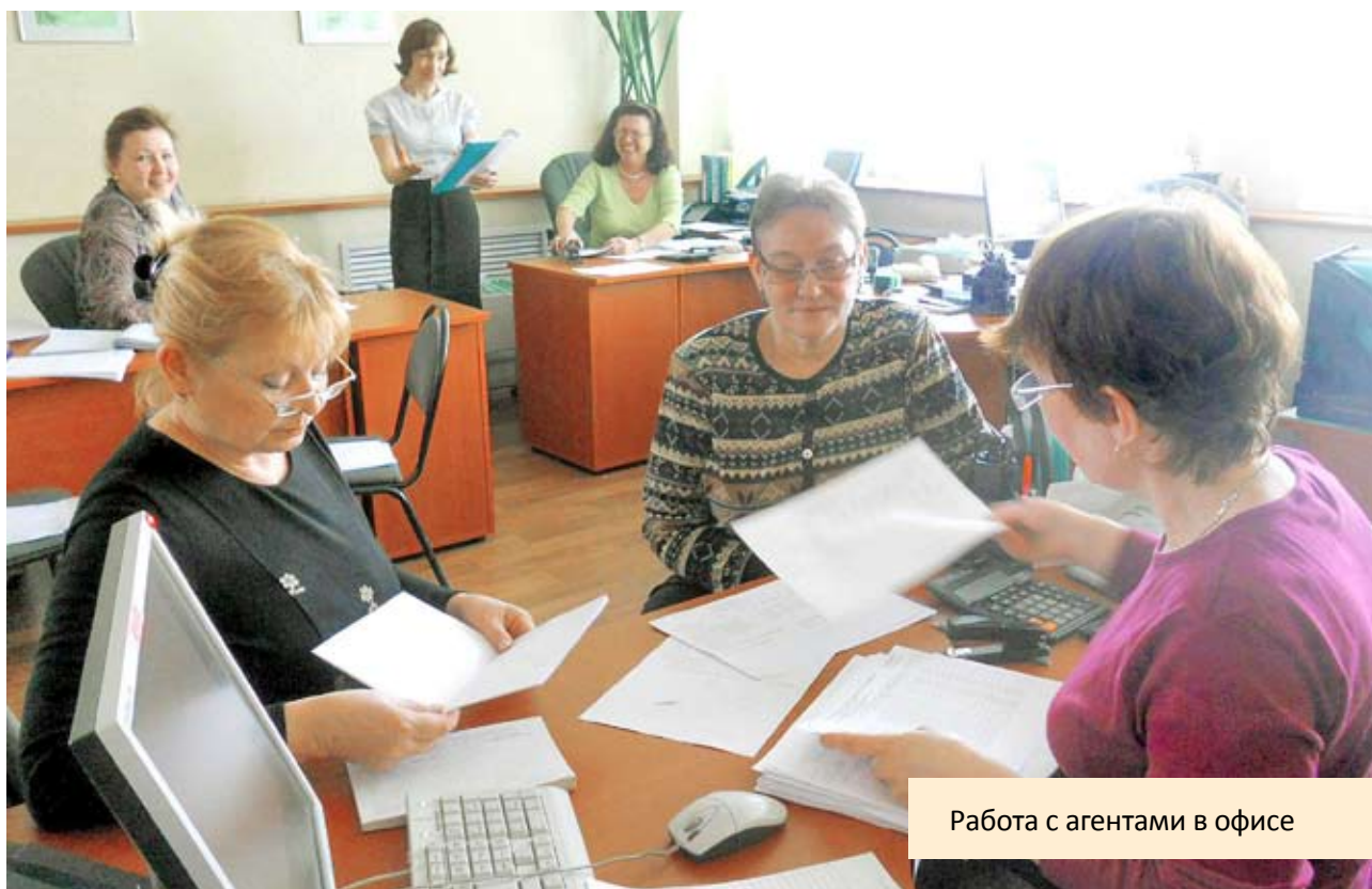
Работа с агентами в офисе

– Моя любовь и моя гордость. Судить о его делах людям. Но мне не стыдно смотреть им в глаза.