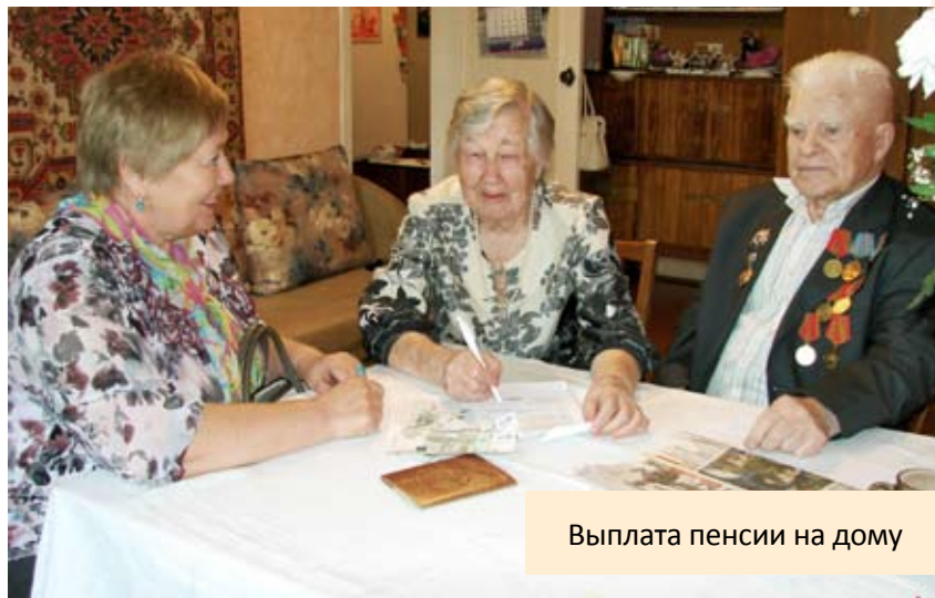
Выплата пенсии на дому

Использование средств электронного документооборота значительно ускоряет процесс перевода пенсии.